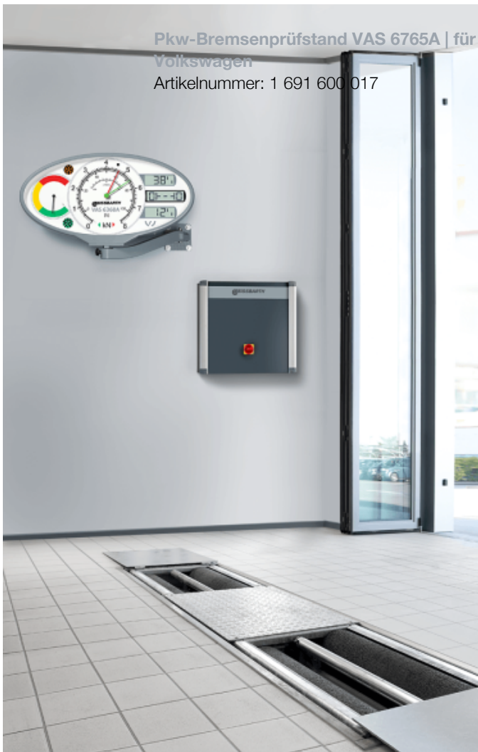
Pkw-Bremsenprüfstand VAS 6765A | für Volkswagen Artikelnummer: 1 691 600 017